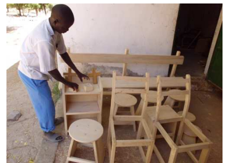
Objets fabriqués en menuiserie