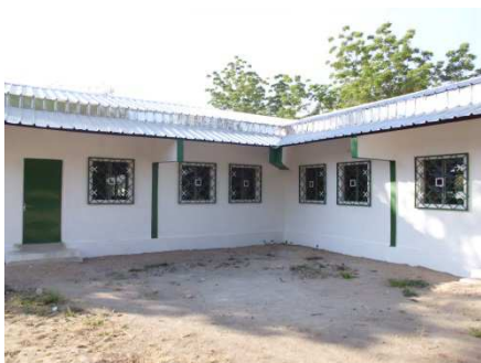
Nouvelles salles de classes

En conclusion : Notre soutien et notre présence auprès de nos amis de Tokombéré est encore plus importante cette année. Merci de ce que vous avez déjà fait ils ont vraiment besoin de notre soutien moral, et pour reprendre une expression d'Intertok adoptons la « Tok attitude » pour rester en lien avec eux.