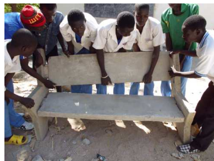
Maçons fabriquant des bancs